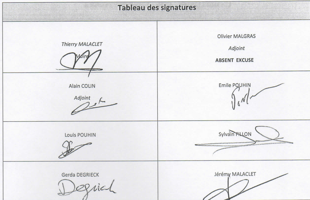
Tableau des signatures